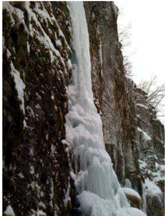
« Erection parlante »

Secteur 5 : c'est le secteur le plus régulièrement formé. Laisser votre imagination tracer une ligne. On y trouve notamment de droite à gauche :