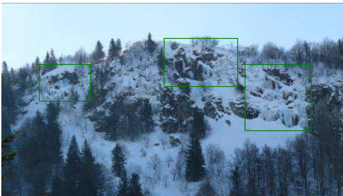
Secteurs 5 - 6 - 7

A noter que du secteur 2 au secteur 5, la barre offre un rocher sain, fissuré avec des langues de glace propices au mixte.