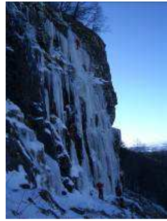
« Bouchetterie »

Secteur 6 : une goulotte, des cigares, un plaqué et dry tooling. Aucune voie officielle dans ce secteur.